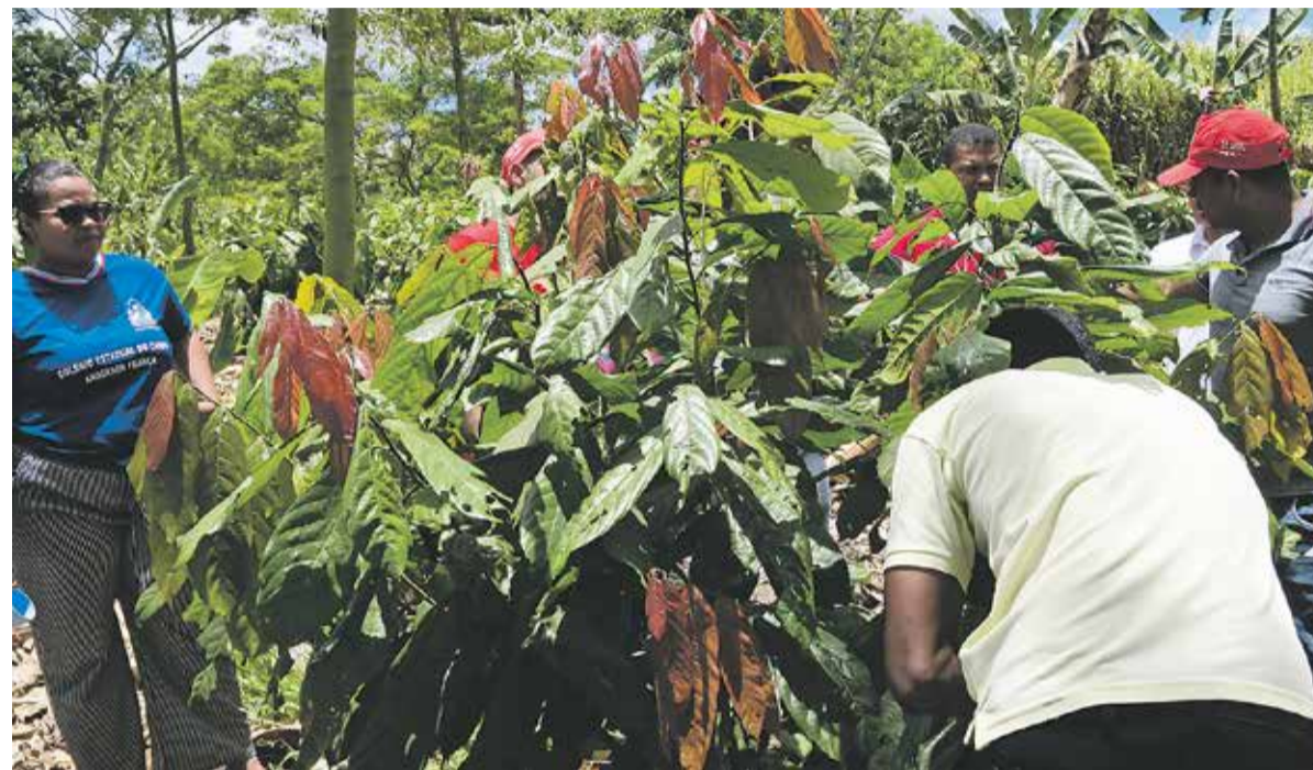
Gestandene Bäuerinnen und Bauern lernen, die empfindlichen Kakaobäume zu schützen

Vor rund zehn Jahren hat Brasiliens Landlosenbewegung die Schule „Egídio Brunetto“ gegründet. Nun könnte die agroökologische Drehscheibe für Forschung und Lehre landesweit zum Modellprojekt werden – wenn die Regierung da Silva Ernst macht mit ihrem Ziel einer nachhaltigen Ökonomie