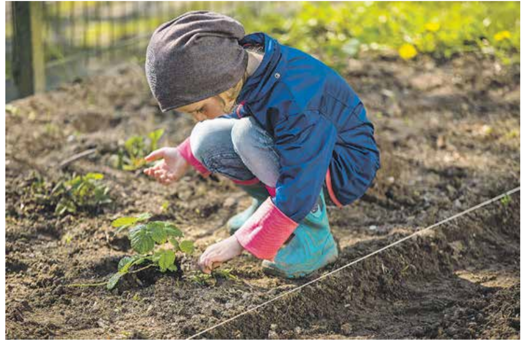
In der Erde wühlen gehört auch zum Gemüseerlebnis